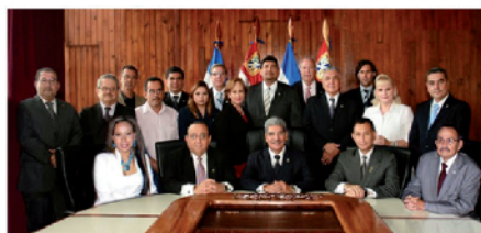
Concejo Municipal de San Salvador 2009-2012

Este año ASMEPEX sostuvo reuniones con la Alcaldesa de Antiguo Cuscatlán, su Concejo Municipal y la Comisión de rótulos, al igual que con la Alcaldía de San Salvador, Santa Tecla y Soyapango; en las reuniones se presentó la gremial, sus acciones a realizar, y se propusieron temas que necesitan trabajarse de la mano con ellos para contribuir con el ordenamiento y combatir con las empresas informales que generan más desorden y devalúan el medio.