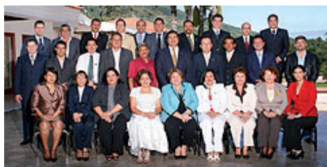
junta directiva comures

En el mes de Octubre, ASMEPEX se reunió con la Junta Directiva de la Corporación de Municipalidades de la República de El Salvador, para exponerles los temas que como ASMEPEX y COMURES deben trabajar de la mano en beneficio mutuo.